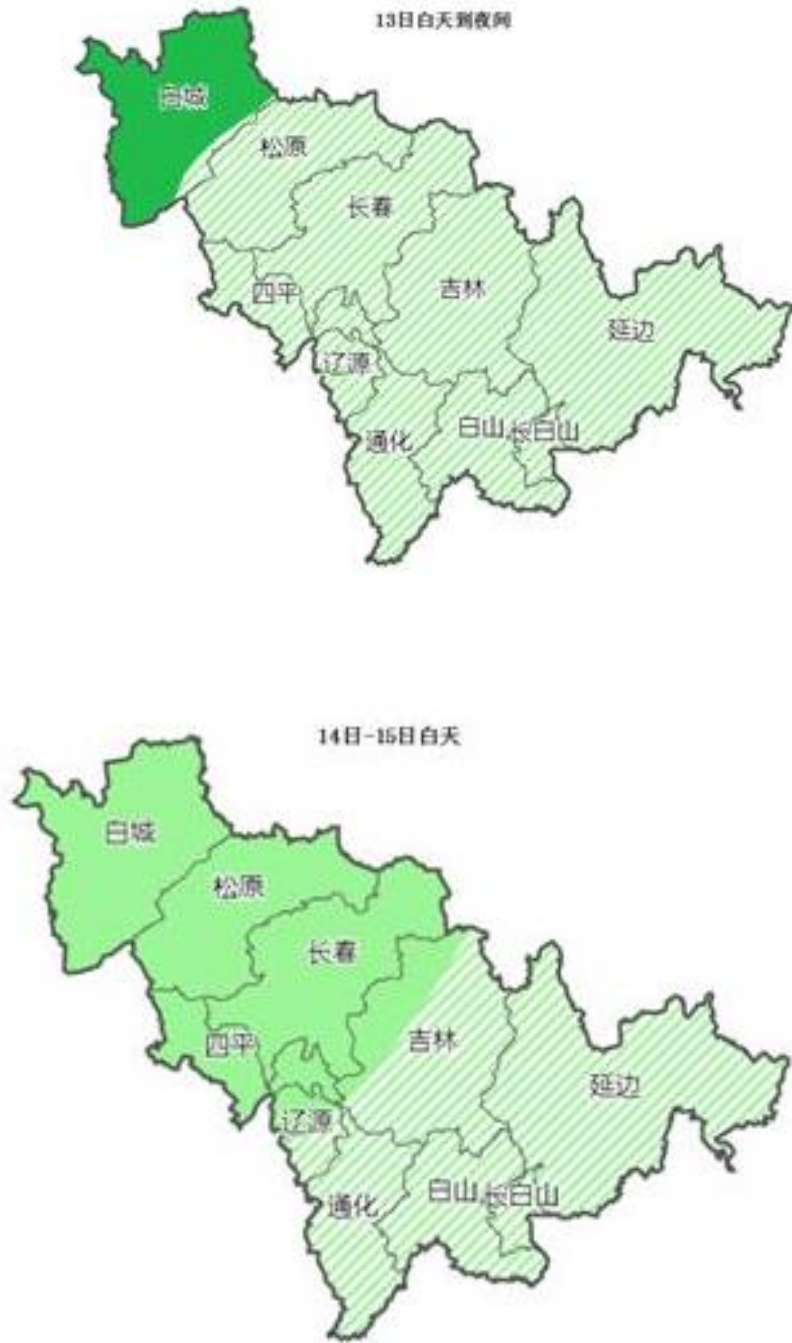
图 3 4月11日午后-15日降水量预报图