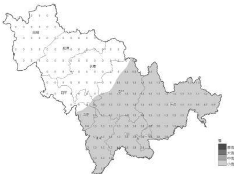
吉林省降水预报图 (单位: mm) 2025年11月27日08时 至 2025年11月27日20时

27日白天，吉林东部和南部、辽源中东部、通化、白山、延边、长白山保护开发区有雨夹雪或小雪。