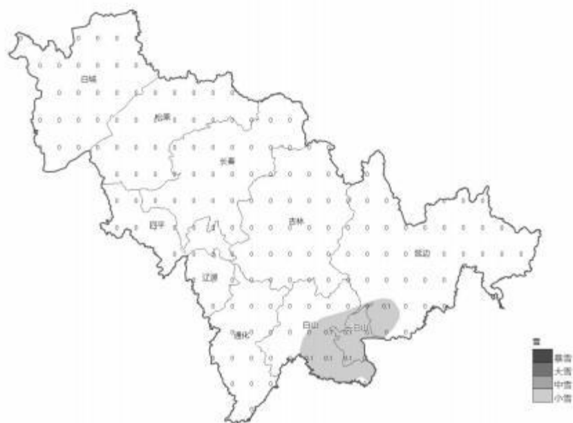
吉林省降水预报图 (单位: mm) 2025年11月27日20时 至 2025年11月28日08时